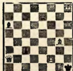
№ 2. Л. И. Куббель, 1925.

Белые выигрывают 1. Фe1+ Крg2 2. Ch3+ Кр: h3 3. Фg1 Koh4 4. Фh2+! Кр~ 5. f4+ (f3+) и выигр.