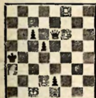
№ 1. В. и М. Платовы, 1911.

Белые выигрывают 1. f7 Фe5 2. Лa8+ Крb3 3. Лa3+ Кр: a3 f8Ф 4. Крb3 Фb4+ f5. Кр: b4 d4+ и выигр.