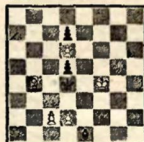
№ 3. Л. И. Куббель, 1928.

Белые выигрывают 1. Ca5 Ch4! 2. Крg4 Ce1! 3. Крh3 Кр~ 4. e4+ (e3) и выигр.