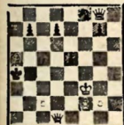
№ 5. Л. И. Куббель, 1926.

Белые выигрывают 1. e4+ Кр: a5 2. Фb3! Фf7+ (Крb6 3. Фa2+ Крb6 4. e3) 3. Крe2 Фb3+! 4. g4! Ф: g4+ 5. Kof1 Крa6 6. Фa4+! Крb6 7. e5 и выигр.