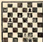
№ 6. А. О. Гербештан, 1928.

Белые делают ничью 1. d7 Ca5 2. Cf4+ Крe6 (Кр: f4 3. e3+) 3. d8K+! C: d8 4. Ce4—b5—a6++