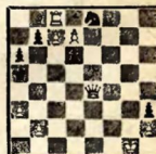
№ 8. А. О. Гербештан, 1932.

Белые выигрывают 1. b4+ Kob6! 2. Ca7+ Кр: a7 3. La3+ Крb6 (Кр: a8 4. d8Ф+! Крa7 5. e8K+! Крb8 6. K: d6+) 4. e8K+ Крe6 5. deФ+ Ф: e8 6. Ka7+ 4... Крe7 5. d8Ф+ Кр: d8 6. K: d6+ и выигр.