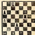
№ 4. Л. И. Куббель, 1928.

Белые выигрывают 1. Le1—e4+ Крa5 (Kob) 2. Le4+! 3. Le8—e5+! Le: e5 3. b4+ Кр: a4 4. bc+ и выигрывают