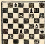
№ 7. А. О. Гербештан, 1928.

Белые выигрывают 1. hg+ Крh7 2. g8Ф+! (2. Л: d3 Ф: d3 3. Cf5+ Крg8 4. Cd3 par) Кр: g8 3. Лd8+ Крh7 4. Л: d1 Фh4 5. Cf5+ Крb6 6. Лh8 Ф: h3 7. g5 и выигр.